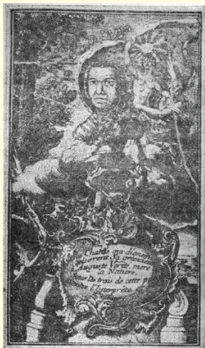
《自然法典》初版扉页